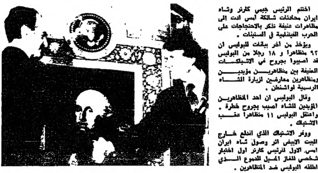
كارتر يرحب بالشاه

احتدم الرئيس جيسي كارتر وشاه إيران محادثات شائكة أمس أدت إلى مظاهرات عنيفة تذكر بالاحتجاجات على الحرب الفيتنامية في الستينات. ويؤخذ من آخر بيانات البوليس أن 92 متظاهراً و 18 رجلاً من البوليس قد أصيبوا بجروح في الاشتباكات العنيفة بين متظاهرين مؤيدين للشاه وبين ضابطي شرطة في طهران. واعتقل البوليس 11 متظاهراً عقب الاشتباك.